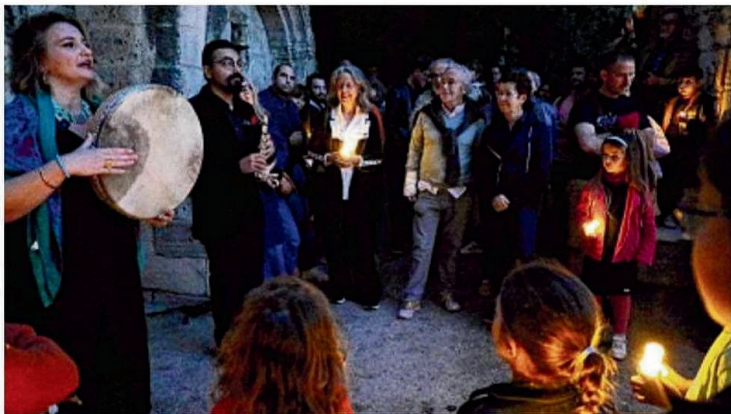
Les musiciens ont notamment fait escale à la chapelle Saint-Accurse à la lumière des bougies.

La musique des flûtes traversières et de la contrebasse se